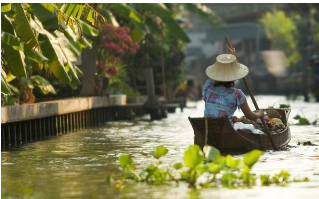
Detailprogramm - Thailand - Nordthailand für aktive Naturliebhaber

Sie fliegen mit einer renommierten Fluggesellschaft in der Economy Class nach Bangkok und von da aus weiter zu Ihrem jeweiligen Urlaubsziel. Den Flugplan mit den genauen Reisedaten werden wir Ihnen rechtzeitig mitteilen. Neue Wege Reisen haftet nicht für Flugplanänderungen, Verspätungen, etc. und daraus resultierenden Programmänderungen. Es gelten die internationalen Bestimmungen der Fluggesellschaften. Gerne berücksichtigen wir Ihre individuellen Flugwünsche wie Business-Class oder anderen Abflughafen, bzw. Verlängerung. Teilen Sie uns diese bitte bei Buchung mit und wir machen Ihnen ein entsprechendes Angebot.